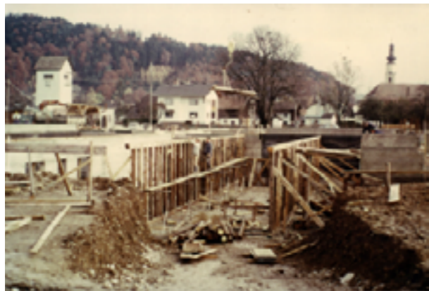
Bauarbeiten für die Hauptschule 1973

Bis 1975 gehörte die Gemeinde Munderfing zum Pflichtsprengel der Hauptschule Mattighofen. Ab September 1975 führte Munderfing eine eigene Hauptschule. Die Errichtung der Hauptschule war vor allem ein Verdienst des Bürgermeisters Johann Wiener. Der Gemeinderat fasste in seiner Sitzung am 11. April 1970 einen einstimmigen Beschluss für die Errichtung einer Hauptschule. 1973 wurde der Gemeinde die Bewilligung zum Bau dieser Schule erteilt.