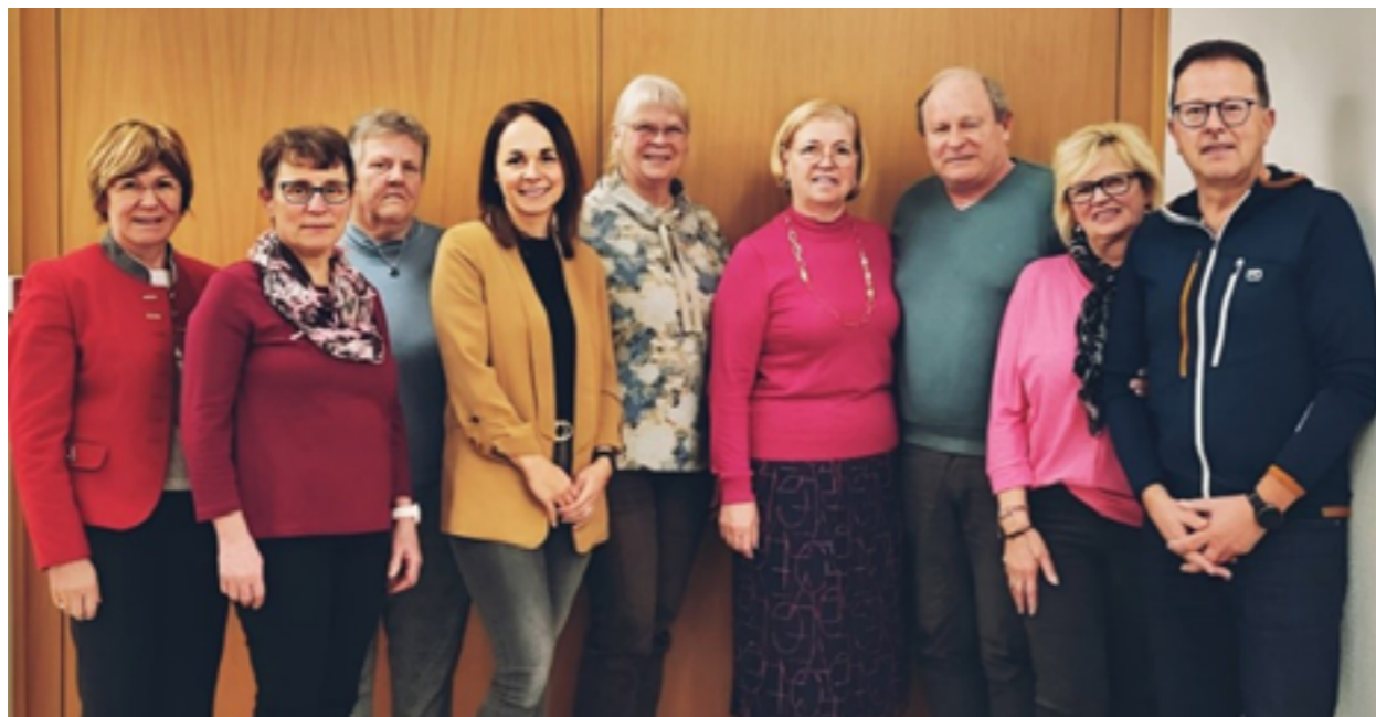
Die engagierten Gründungsmitglieder von dem Verein „Zeitbank“ in Munderfing.

Wir laden euch herzlich zur INFO-VERANSTALTUNG am Dienstag, 13. Mai 2025 um 19.30 Uhr im Gasthaus Weiß ein, bei der es genauere Informationen gibt.