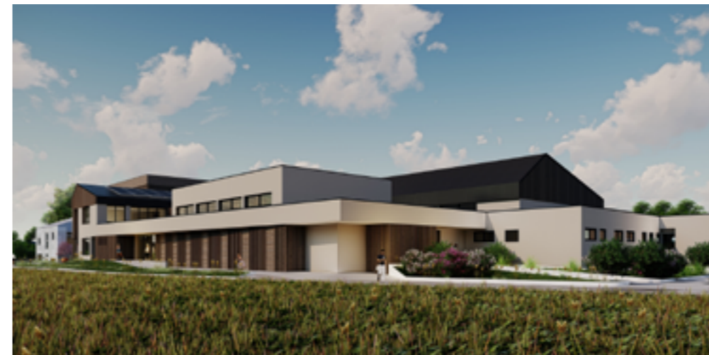
Blick von der Schulstraße in Richtung der neuen Turnsäle.