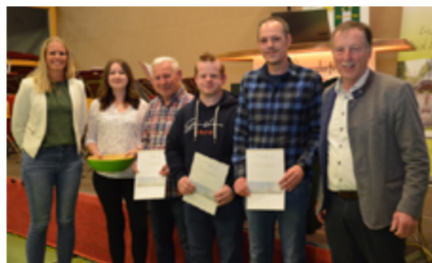
Die Gewinner eines Besichtigungstermin für ein Maschinenhaus des Windparks.

Ein Highlight war die Verlosung der Besichtigungstermine für ein Maschinenhaus des Windparks. Drei glückliche Gewinner dürfen sich demnächst auf dieses besondere Erlebnis freuen.