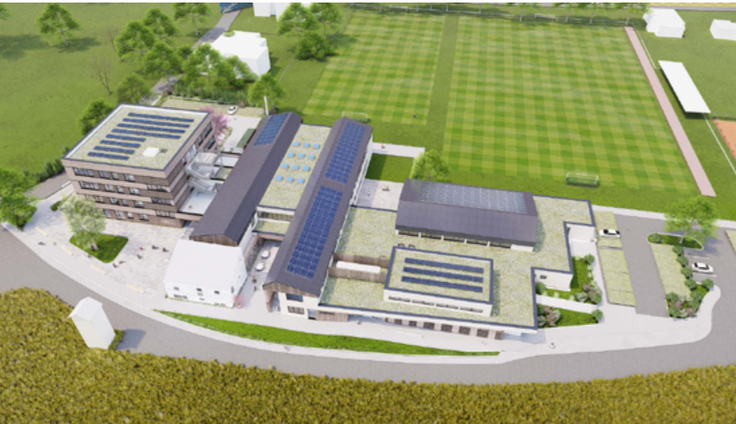
Visualisierung von dem geplanten Bauprojekt (Bilder beidseitig: STÖGMÜLLER ARCHITEKTEN ZT GmbH)

Baubeginn ist für den Sommer 2025 geplant. Baufertigstellung wird voraussichtlich 2027 sein.