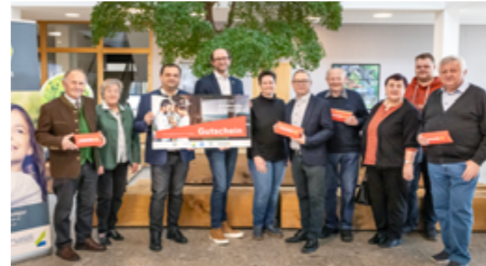
Bildtext: Die Gewinnerinnen und Gewinner der KEMergie Challenge

durch die Initiierung der Kooperation mit Hargassner, die Förderaktion „Raus aus Öl und Gas“ wesentlich verstärkt wurde und aufgrund der räumlich großen Ausdehnung über den gesamten Bezirk das energiegeladene Gewinnspiel mit seiner Strahlkraft rund 100.000 Einwohner und zusätzlich mehr als 12.000 Besucher der Hargassner Hausmesse im September 2024 erreichte.