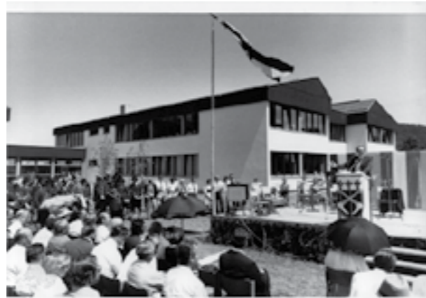
Feierliche Einweihung der Hauptschule

Für die Zukunft werden dann die Volksschule und Mittelschule auf einen gemeinsamen Standort zusammengeführt.