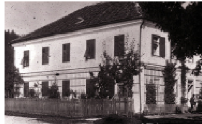
Volksschule um 1910

Vor 1852 war die Volksschule mit zwei Klassen im hölzernen Mesnerhaus neben der Kirche untergebracht. Dieses wurde bei einem Großbrand im Dezember 1852 vollständig vernichtet.