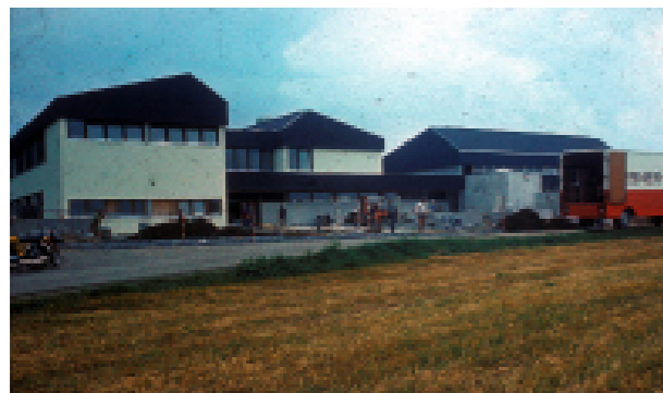
Bauarbeiten für die Hauptschule 1975

Im Kellergeschoß war ursprünglich ein Hallenbad geplant. Wegen der zu erwartenden hohen Folgekosten, der Probleme mit dem Grundwasser und