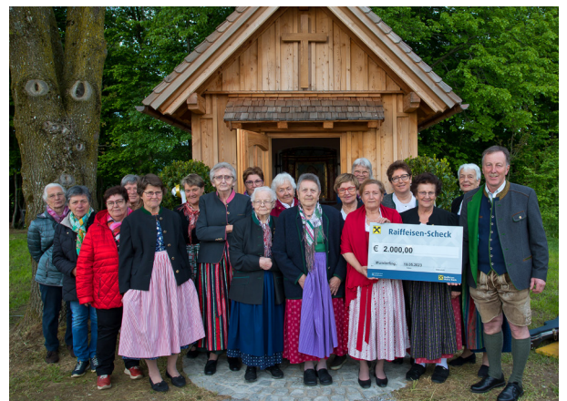
Spendenübergabe bei der neu renovierten Siebenschläferkapelle

Am 06. Mai besuchten wir die Bezirksmaiandacht in Polling.