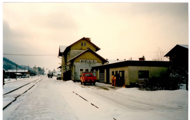
Bahnhof Munderfing in den 80er Jahren