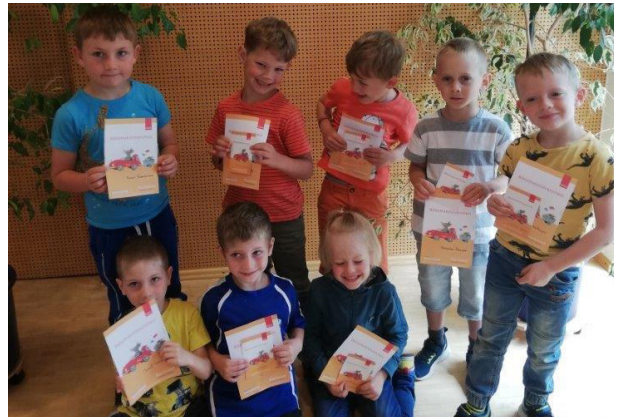
Schulanfänger der Waldgruppe

Die Freude darüber war den Kindern ins Gesicht geschrieben. Das Team der Bibliothek freut sich darauf, die Führerscheinbesitzer im kommenden Schuljahr als Leseanfänger wieder in der Bücherei Munderfing zu begrüßen.