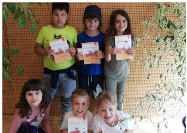
Schulanfänger der Schmetterlingsgruppe