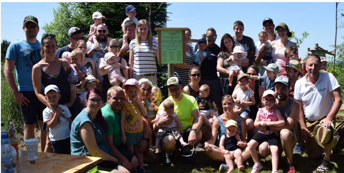
Willkommensfest für alle Neugeborenen im Generationenwald