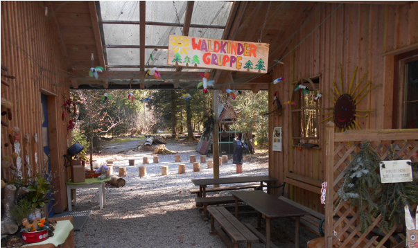
Der Waldkindergarten heute.