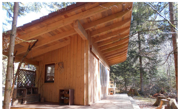
Der Waldkindergarten heute.

Im spielerischen Umgang mit der Natur erfährt das Kind seine eigenen Fähigkeiten und Fertigkeiten, aber auch die eigenen Grenzen.