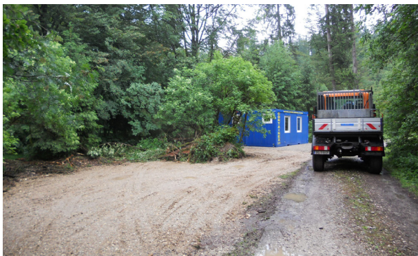
Über 10 Jahre ist es bereits her, dass mit den Bauarbeiten begonnen wurde!

Um auch den Hygienestandards gerecht werden zu können ist in den letzten Jahren eine Sanitäreanlage mit Kinder-WC's sowie Waschbecken mit Warmwasser im Waldkindergarten entstanden.