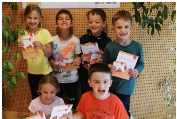
Schulanfänger der Blumengruppe