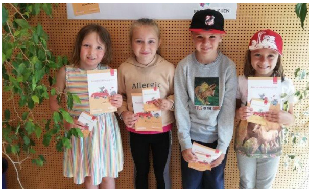
Schulanfänger der Regenbogengruppe