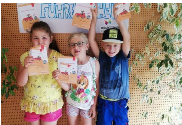
Schulanfänger der Sonnengruppe