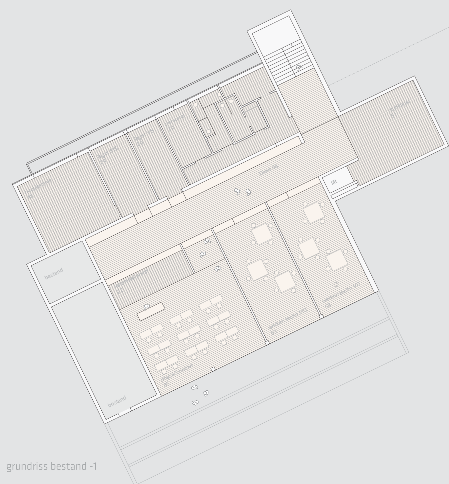
grundriss bestand -1

Die Erdgeschosse beider Schulen verbinden sich zu einem flächig organisierten Geschoß. Dieser Bereich entspricht der „gemeinsamen Mitte“ des Organigramms. In beiden Schulen sind die Obergeschosse durch zentrale Lufträume mit dem Erdgeschöß verbunden, sie sind reine Klassengeschosse und bilden die jeweils internen Bereiche der beiden Schultypen ab. Im Sinne eines möglichst kleinen Fußabdrucks und zum Vorteil eines großzügigen Freiflächenangebotes, wird die Turnhalle im Untergeschoß des Neubaus angeordnet.