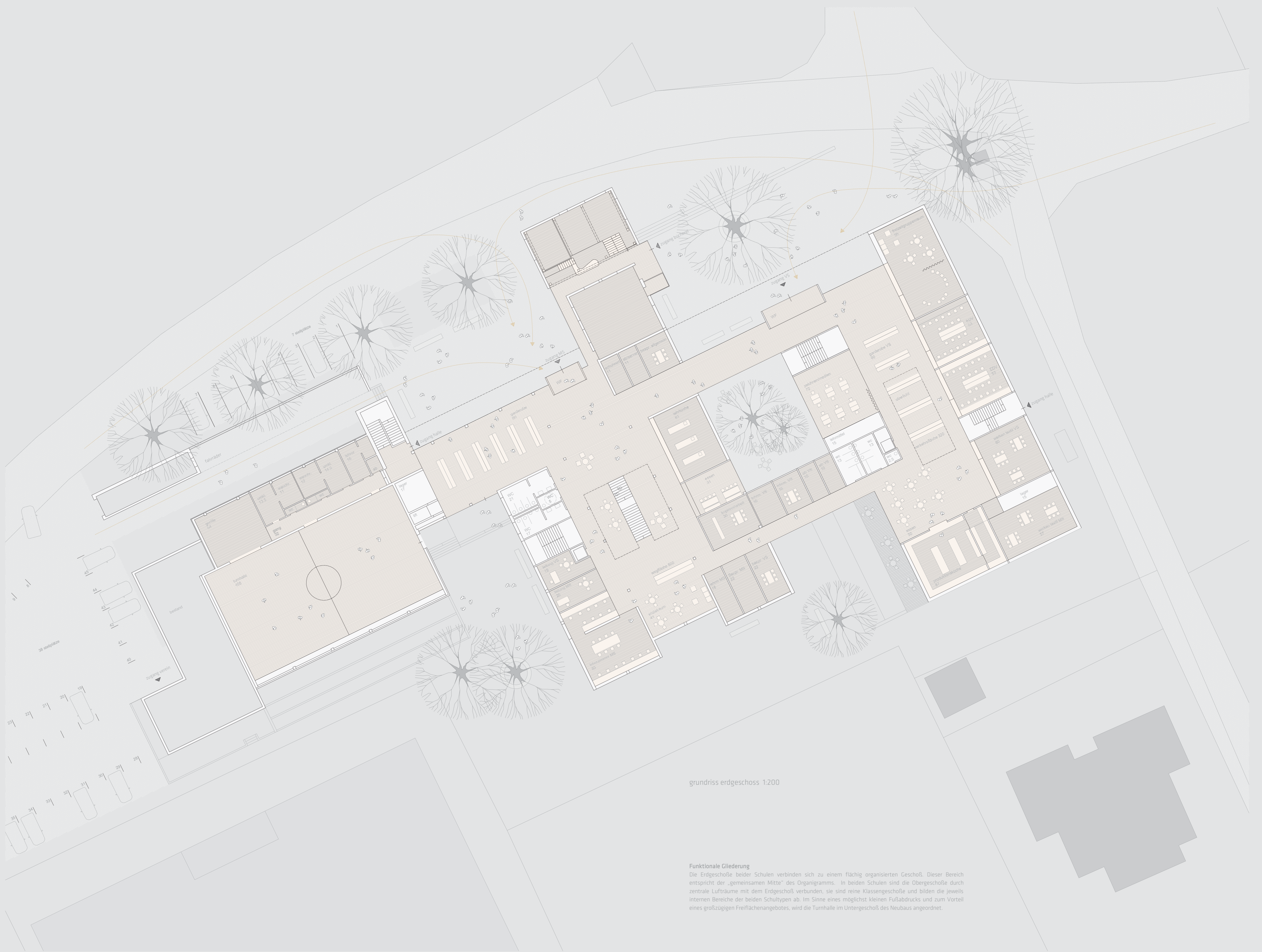
grundriss edggeschoss 1:200