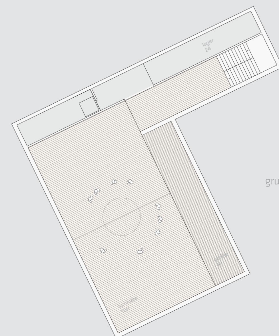
grundriss neubau -2