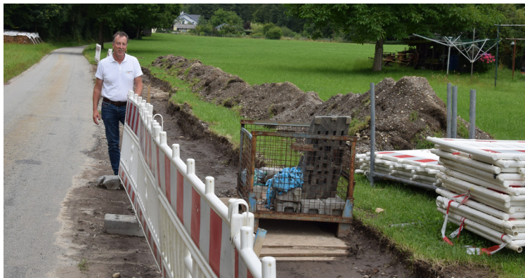
Erweiterung der Wasserversorgungsanlage Bradirn