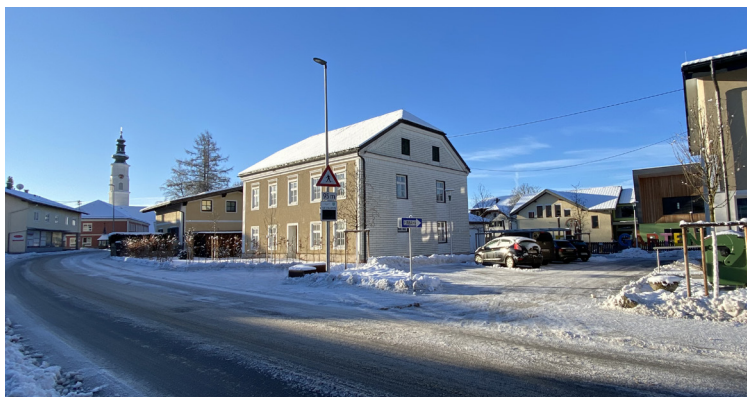
Der neu gestaltete Kindergartenvorplatz