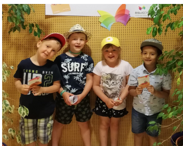
Schulanfänger der Blumengruppe