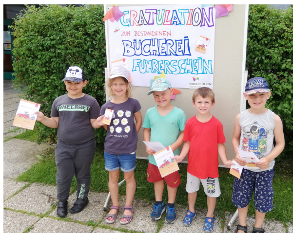
Schulanfänger der Regenbogengruppe