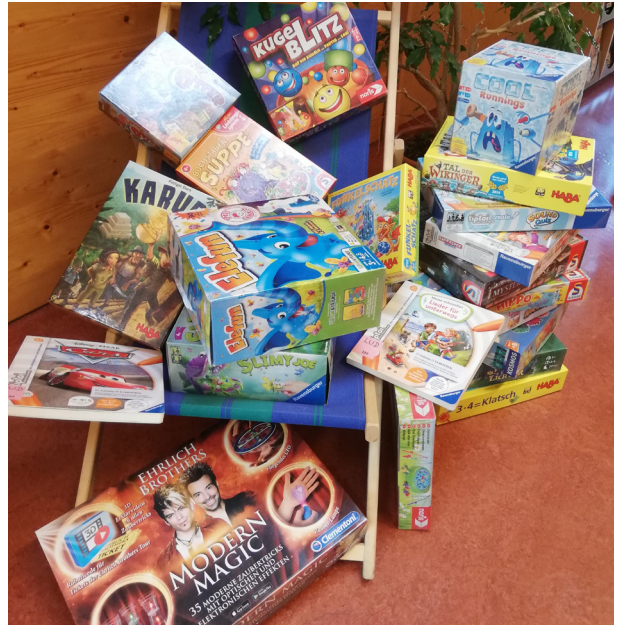
Neues aus der Ludothek

„Endlich. Nach einer langen Schiffsreise haben die Schatzjäger die Insel Karuba erreicht und können sich auf die Jagd nach den verborgenen Schätzen machen. Wer führt sein Expeditionsteam möglichst clever über die Dschungelpfade, achtet auf die Mitspieler und hält die Augen nach Gold und Kristallen am Wegrand offen? Und wer sichert sich die wertvollsten Tempel-Schätze? Ein fesselndes Legeabenteuer für 2-4 Schatzjäger ab 8 Jahren“.