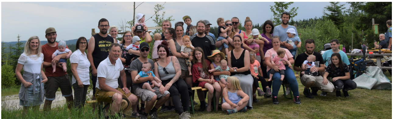
Picknick im Generationenwald für alle 2020 Neugeborenen mit ihren Eltern