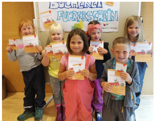
Schulanfänger der Sonnengruppe

Am Ende der Kindergartenzeit haben die Schulanfänger auch in diesem Jahr die Führerscheine zusammen mit einer Urkunde erhalten. Die Freude darüber war den Kindern ins Gesicht geschrieben. Das Team der Bibliothek freut sich darauf, die Führerscheinbesitzer im kommenden Schuljahr als Lesanfänger wieder in der Bücherei Munderfing zu begrüßen.