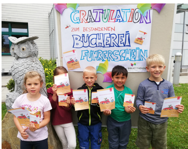
Schulanfänger der Schmetterlingsgruppe