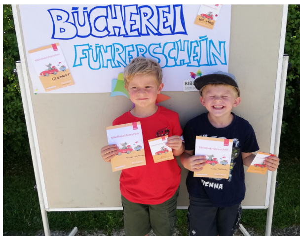
Schulanfänger der Waldgruppe