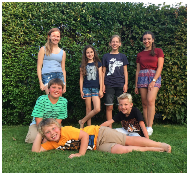
Jungmusikernachmittag