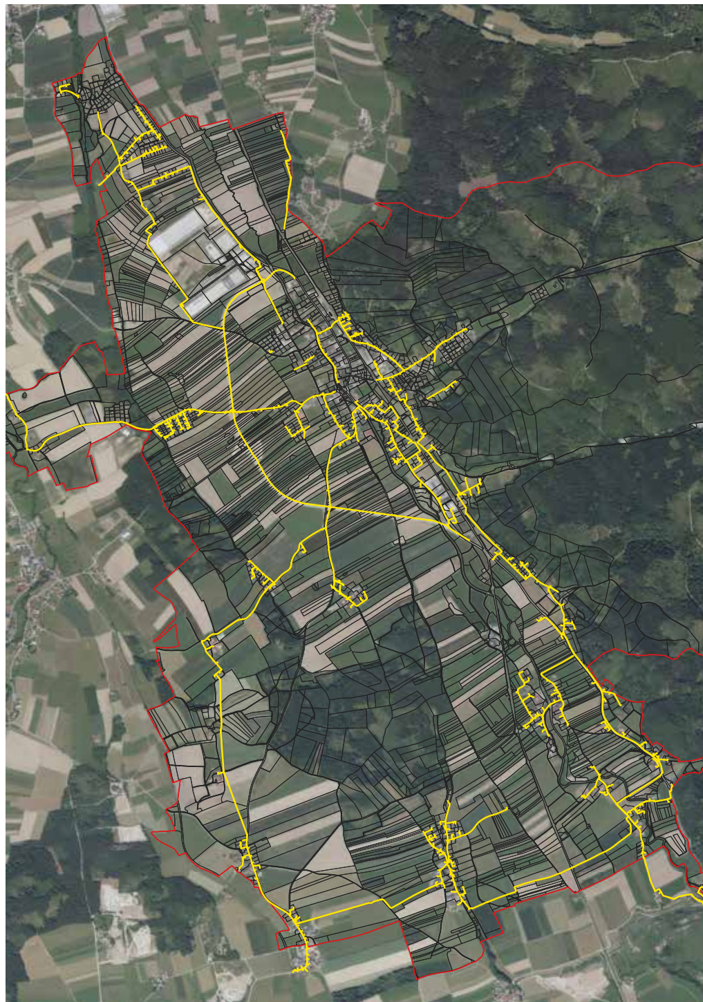
In gelb markiert der bereits getätigte Glasfaserausbau in Munderfing