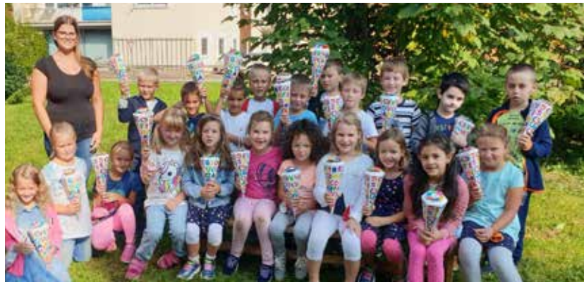
1 b Klasse