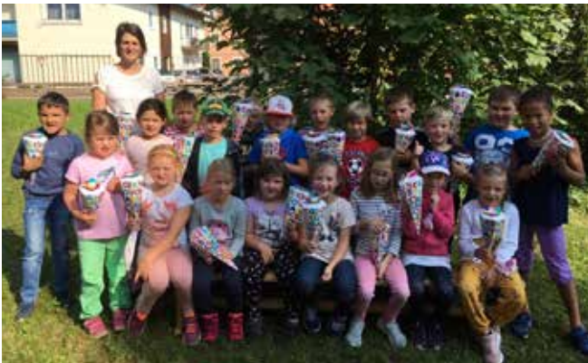
1 a Klasse