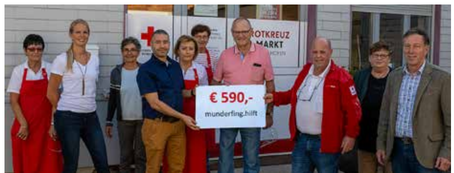
Spendenübergabe