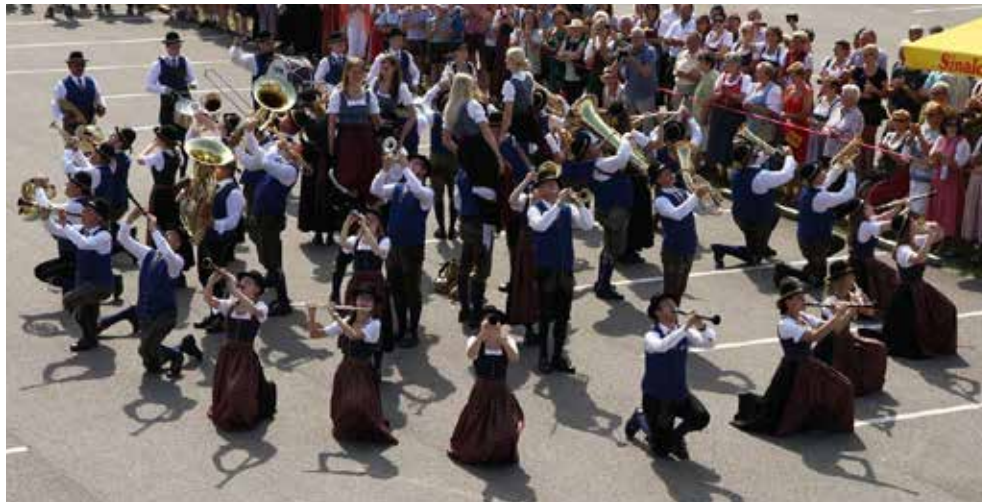
Ortsmusik Munderfing - Marschwertung

Zum Schluss erblühte eine Rose indem die vier Marketenderinnen von Musikerinnen in die Höhe gehoben wurden. Das Showprogramm kam bei den Zusehern sehr gut an und die Ortsmusik Munderfing erreichte einen ausgezeichneten Erfolg mit 90,75 Punkten.