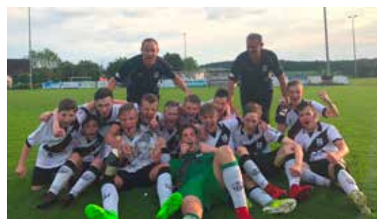
U 15 Mannschaft