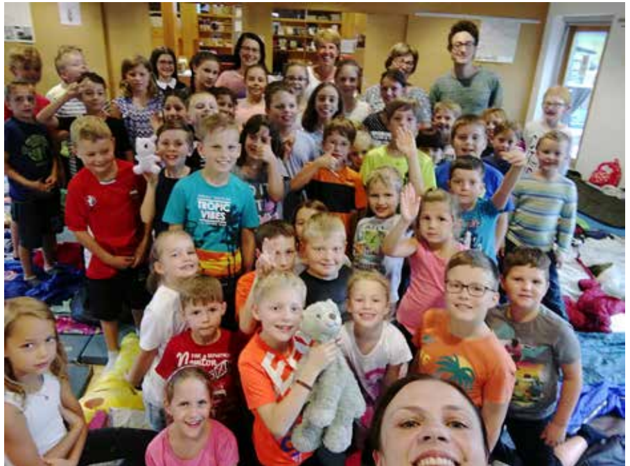
„Gespensternacht“ im Bildungszentrum