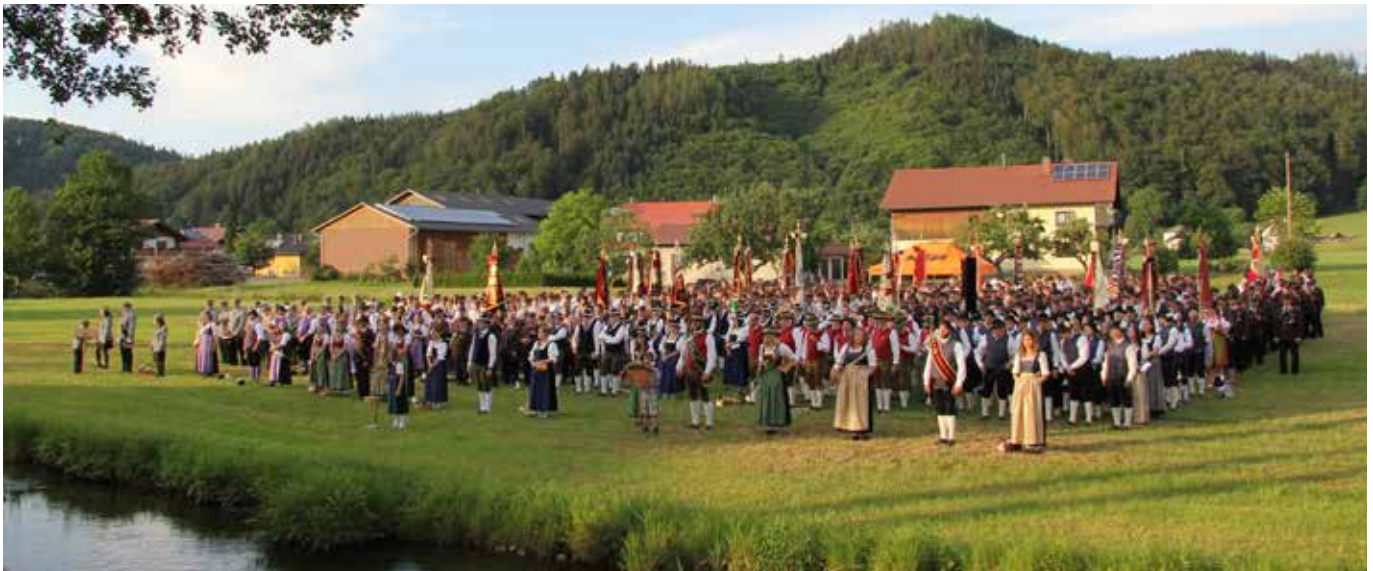
Feuerwehrfest Achenlohe im Juni 2018