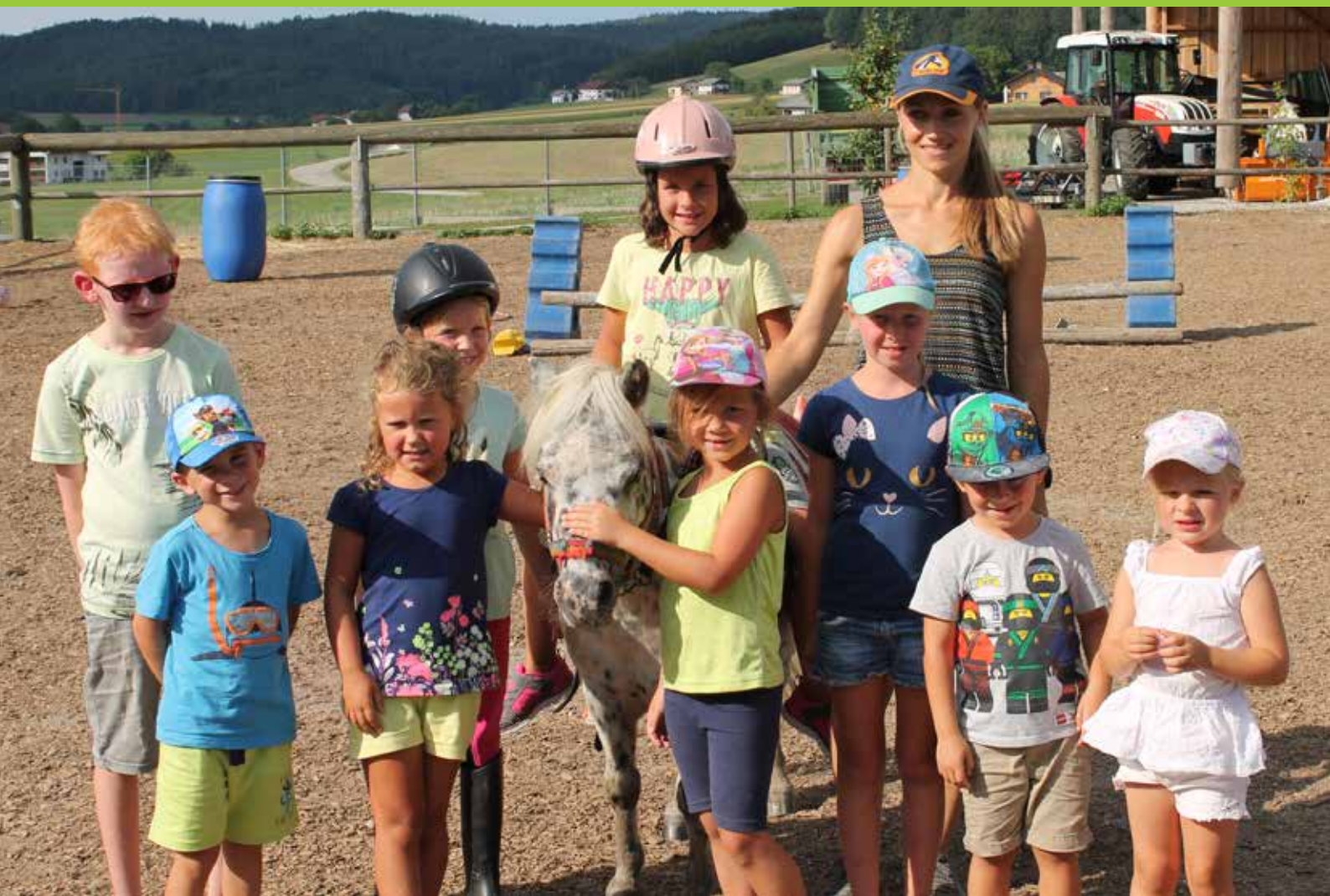
Spaß mit Ponys