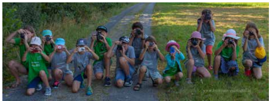
Ferienaktion „Kinderleicht Fotografieren“

Mit dabei waren 14 Kinder. Während einem sogenannten Fotowalk (Spazieren und Fotografieren) erfuhren die Kinder allerlei über die Kameras und machten im Anschluss recht sehenswerte Bilder. Zur Erinnerung bekamen alle Kinder ein T-Shirt und alle Bilder der Ferienaktion auf CD. Das Fototeam-Mattigtal freut sich schon jetzt auf die Ferienaktion 2019.