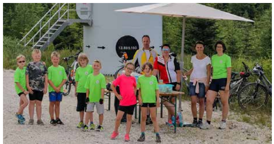
Windparklauf: Die Teilnehmer des Windparklaufes waren über die top vorbereitete Labstation mit allen Erfrischungen durch die Kids on Bike sehr froh.