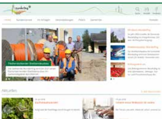
Neue Webseite der Gemeinde

Durch Windel für Kleinkinder kommt es zu einem vermehrten Müllaufkommen. Um Familien/Mütter finanziell etwas zu entlasten, >>