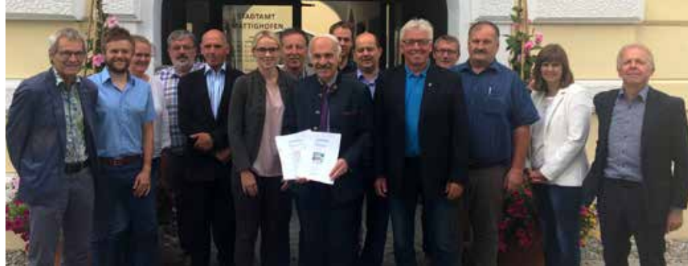
Beschluss der Stadtregionalen Strategie, Juni 2018

Das inkludierte räumliche Leitbild dient als gemeinsame Grundlage zur Optimierung einer abgestimmten und qualitätsvollen Raumentwicklung und soll zukünftig ergänzend zu örtlichen Planungsinstrumenten sowie bei entsprechenden stadtregional relevanten Planungsvorhaben herangezogen werden.